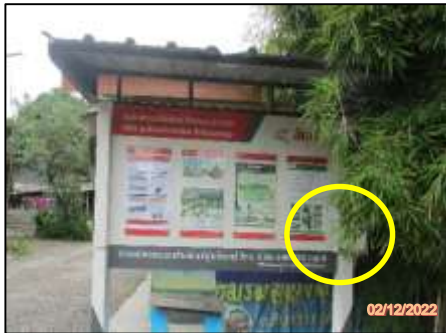
กล่องรับเรื่องร้องเรียน หมู่ 4