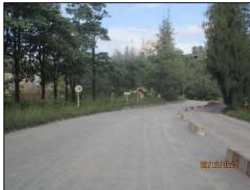
รูปที่ 2-5 การดูแลเส้นทางลำเลียงแร่ และเส้นทางขนส่งแร่ของโครงการ