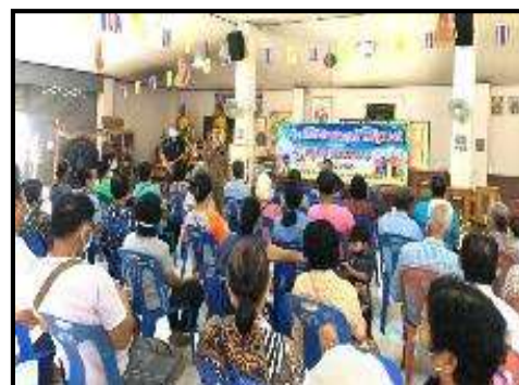
รูปที่ 2-13 ตัวอย่างกิจกรรมชุมชนสัมพันธ์ระหว่างเดือนกรกฎาคม - ธันวาคม พ.ศ. 2565