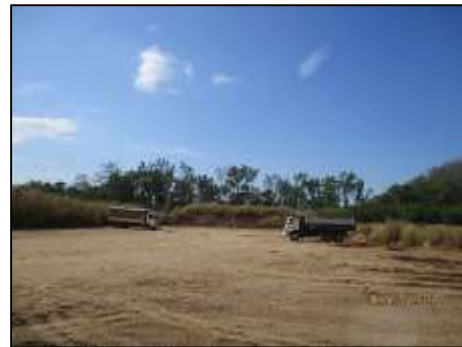
รูปที่ 2-18 การจัดเก็บรักษาอุปกรณ์ รถ เครื่องจักร หลังเลิกใช้งาน