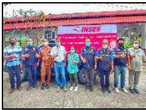
รูปที่ 2-13 (ต่อ) ตัวอย่างกิจกรรมชุมชนสัมพันธ์ระหว่างเดือนกรกฎาคม - ธันวาคม พ.ศ. 2565