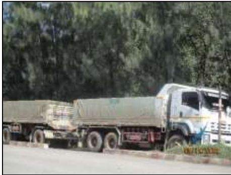
รูปที่ 2-7 รถบรรทุกที่มีผ้าใบปิดคลุมมิดชิด