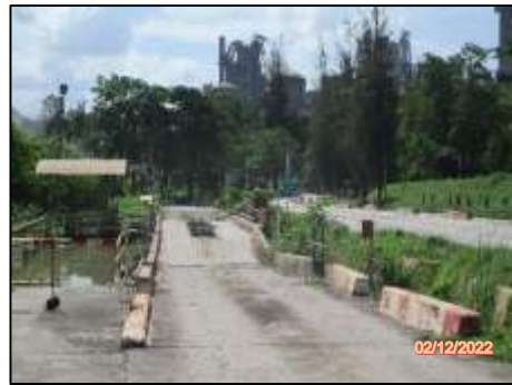
รูปที่ 2-8 พื้นที่ล้างล้อรถบรรทุก