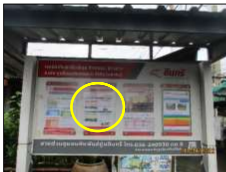
ประชาสัมพันธ์บริเวณ หมู่ 9