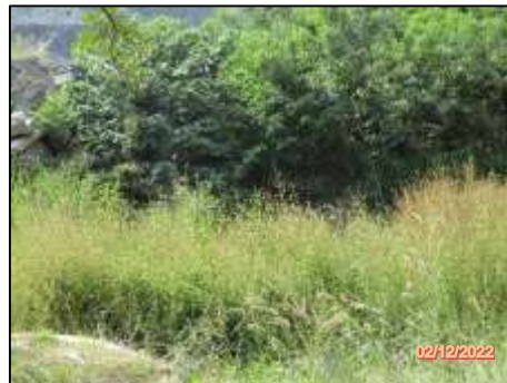
รูปที่ 2-10 ไม้ยืนต้นบริเวณโครงการ และการปลูกไม้ยืนต้นเพิ่มเติม