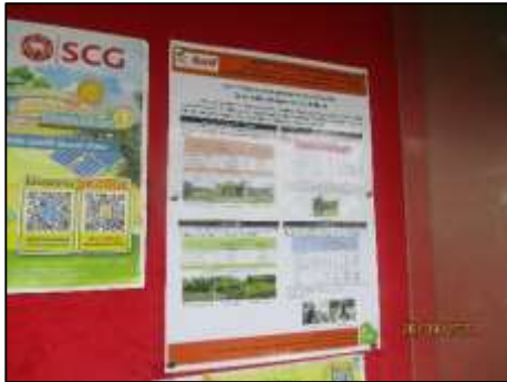
ประชาสัมพันธ์บริเวณ รพ.สต. ทับทวน