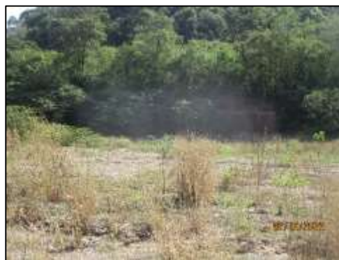
รูปที่ 2-2 พื้นที่ที่ไม่เกี่ยวข้องกับการทำเหมือง และ Buffer Zone