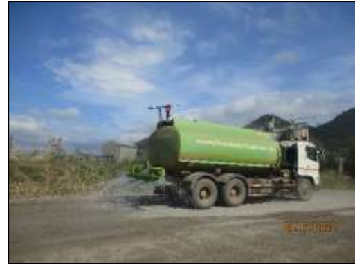
รูปที่ 2-4 รถขณะฉีดพรมน้ำในบริเวณโครงการ