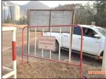
รูปที่ 2-17 ป้ายห้ามบุคคลภายนอกเข้าพื้นที่การทำเหมือง