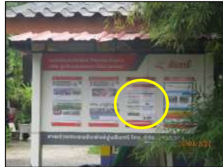
ประชาสัมพันธ์บริเวณ หมู่ 4