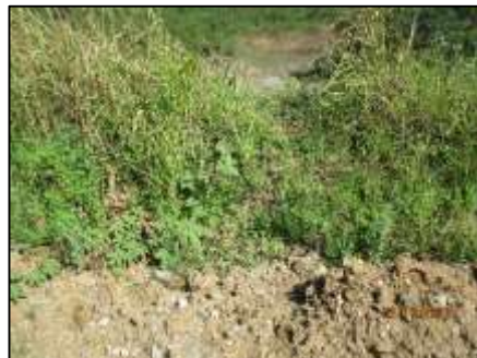
รูปที่ 2-11 คันทำนบดินรอบพื้นที่ทำเหมืองและการปลูกพืชคลุมดิน