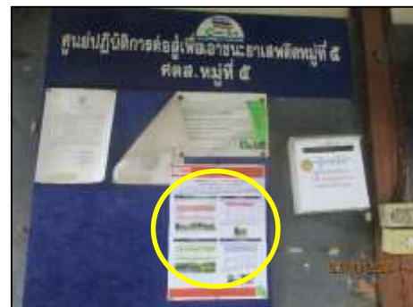
ประชาสัมพันธ์บริเวณ หมู่ 5