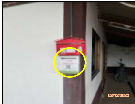
กล่องรับเรื่องร้องเรียน หมู่ 9