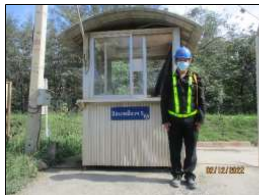
รูปที่ 2-6 ป้ายควบคุมความเร็วไม่เกิน 30 กม./ชม. ป้ายจราจรบริเวณโครงการ และเจ้าหน้าที่ดูแลทางเข้า-ออก โครงการ