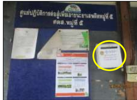
กล่องรับเรื่องร้องเรียน หมู่ 5