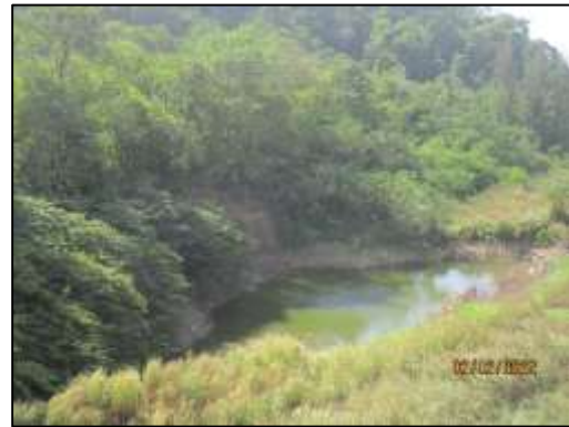
รูปที่ 2-1 ภาพการเปิดหน้าเหมืองแบบขั้นบันไดของโครงการ