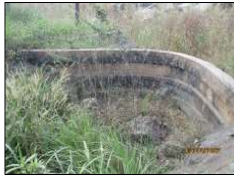
รูปที่ 2-9 บ่อรับน้ำ (Sump)