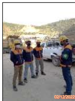
รูปที่ 2-16 พนักงานสวมใส่อุปกรณ์ป้องกันภัยส่วนบุคคล (PPE)